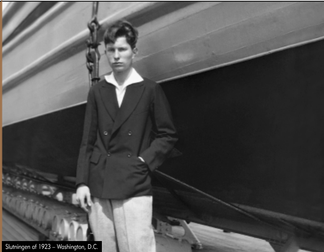
Slutningen af 1923 – Washington, D.C.