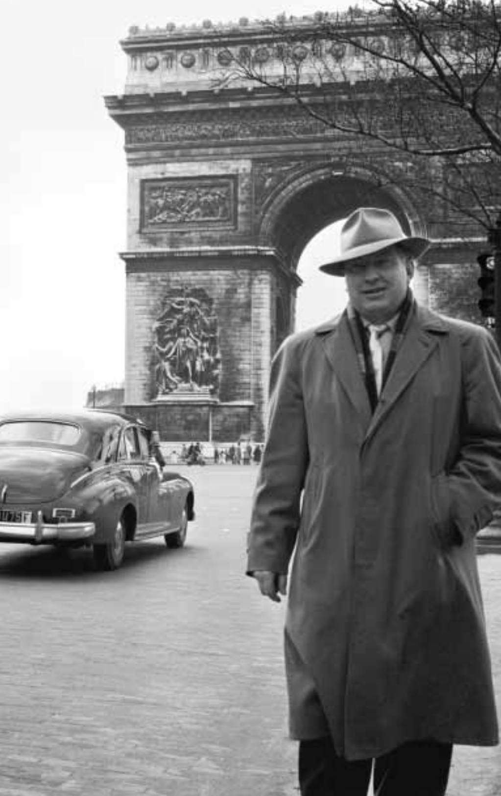
L. Ron Hubbard i Paris, 1953.

“Jeg har ikke levet et afsondret liv og har ingen respekt for vismanden, som ikke har levet og den lærde, som ikke vil dele med andre.