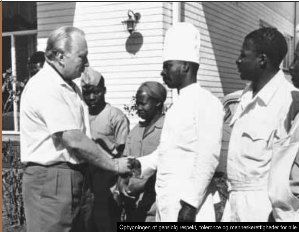
Opbygningen af gensidig respekt, tolerance og menneskerettigheder for alle

H an sejlede vidt omkring i de følgende syv år, hvor han fokuserede mere og mere på de stadig voksende problemer, som samfundet stod over for i slutningen af 1960'erne og begyndelsen af 1970'erne. Fra denne periode bør især fremhæves det program, han udviklede til rehabilitering af