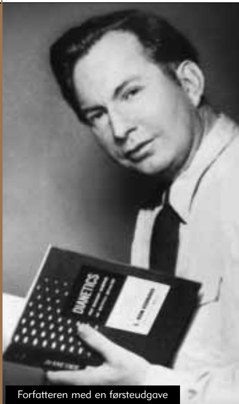
Forfatteren med en førsteudgave