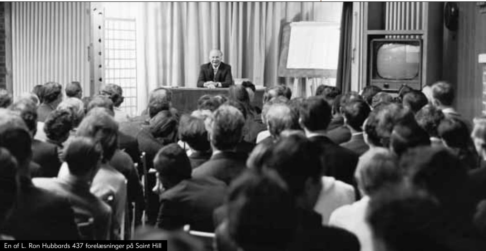
En af L. Ron Hubbards 437 forelæsninger på Saint Hill

På Saint Hill Manor syd for London uddannede Hubbard intensivt scientologer, ikke alene fra Europa, men fra hele verden, så de kunne vende tilbage til deres hjemlande og undervise andre.