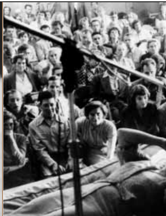
En af de tidlige demonstrationer L. Ron Hubbard laver af Dianetik teknikken

L Ron Hubbards venner og kolleger var chokerede over reaktionerne fra sundhedssektorens bastioner. På den ene side var der hundreder af journaler med vildt begejstrede vidnesbyrd fra mennesker, som havde studeret og brugt Dianetik, samt tusinder af breve fra folk, som ønskede at vide mere. Over for det stod de få "eksperter", som greb til 220 volts strøm for at løse sindets problemer, og som aldrig havde sat