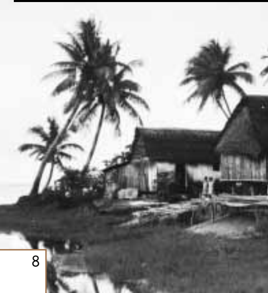
1928 – Guam

lamaklostre i Kinas vestlige bjerge, som ellers var forbudt område både for de lokale bønder og for fremmede.