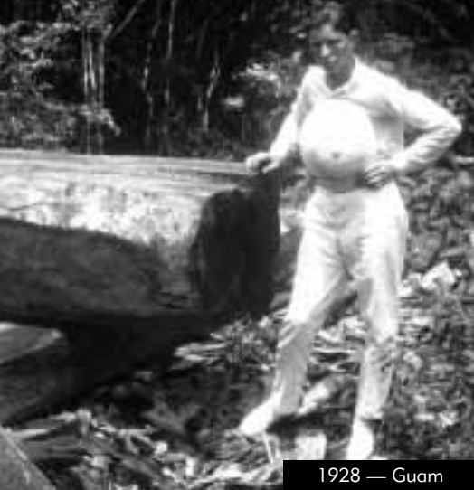
1928 — Guam

Rons første rejser over Stillehavet førte ham til junglen i Guam, Kinas kyster og op i Himalaya. Som 17-årig forevige han syv af den Kinesiske Murs bugtninger i et sjældent fotografi (herunder), som han tog nær Nan-k'ou-passet vest for Beijing. Hans fotografier fra Asien solgte han til det internationale fotobureau, Underwood & Underwood, og til National Geographic.