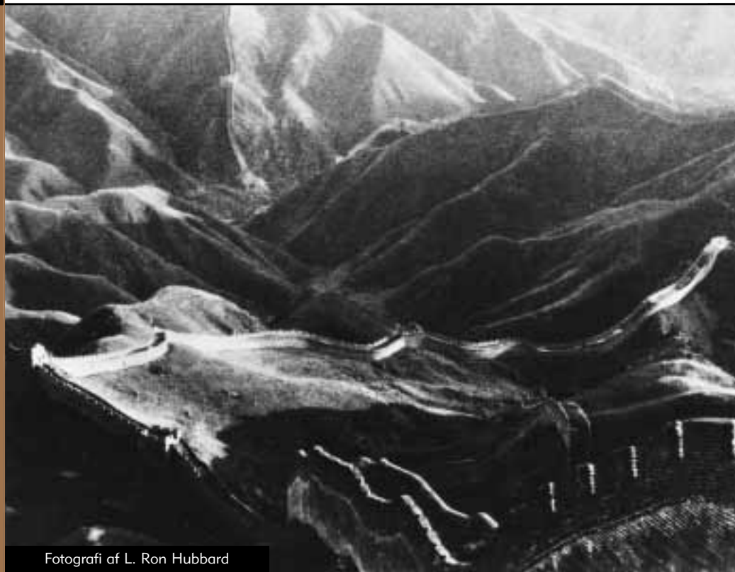
Fotografi af L. Ron Hubbard

Undervejs på sine rejser i Asien fik Ron adgang til sjældent besøgte buddhistiske templer i de vestlige bjerge i Kina. Den tid han brugte sammen med munke og aldrende kinesere viste sig at blive en uvurderlig erfaring i hans søgen efter svarene på menneskets basale spørgsmål.