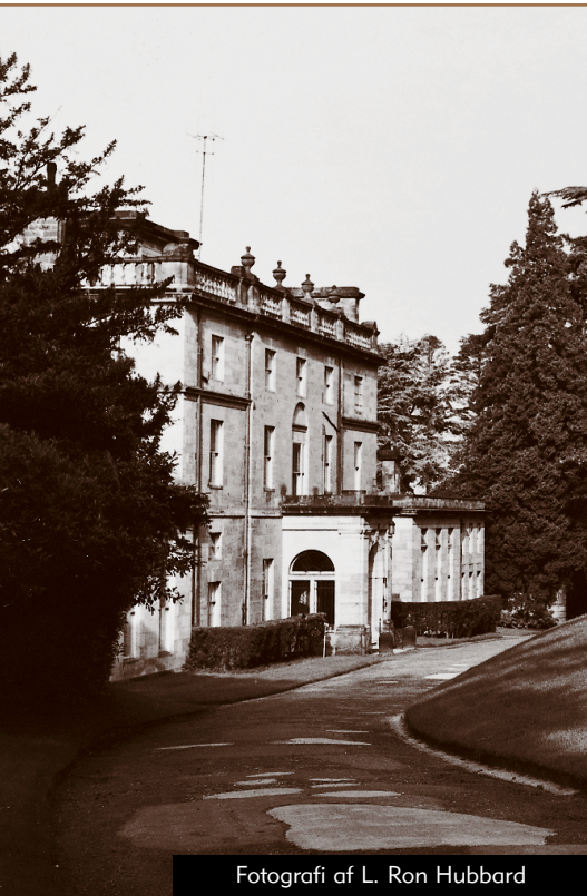
Fotografi af L. Ron Hubbard

I 1959 indrettede L. Ron Hubbard Saint Hill Manor (herover) og flyttede ind med sin familie. Her voksede hans børn op og her tog han initiativet til forskellige lokale udviklingsprojekter. Han oprettede Saint Hill College og ledede den internationale udbredelse af Scientologi religionen.