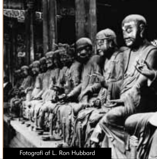
Fotografi af L. Ron Hubbard

Han fandt klasseværelset for begrænsende og fik arrangeret at kunne rejse omkring i Orienten om bord på skibe som USS Henderson (herunder). Blandt de mange fotografier, han tog, var blandt andet det fascinerende tempel med et tusind Buddhaer (til højre), og kejserinde Dowager Cixi's sommerpalads, (herunder til højre), begge i Beijing.