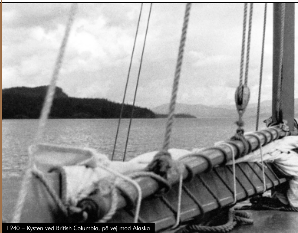
1940 – Kysten ved British Columbia, på vej mod Alaska

“For virkelig at forstå livet, må man være en del af det, man må ned og se, man må ind i livets kroge og hjørner. Man må blande sig med alle slags mennesker, før man kan sige noget konkret om, hvad mennesket er.” – L. Ron Hubbard