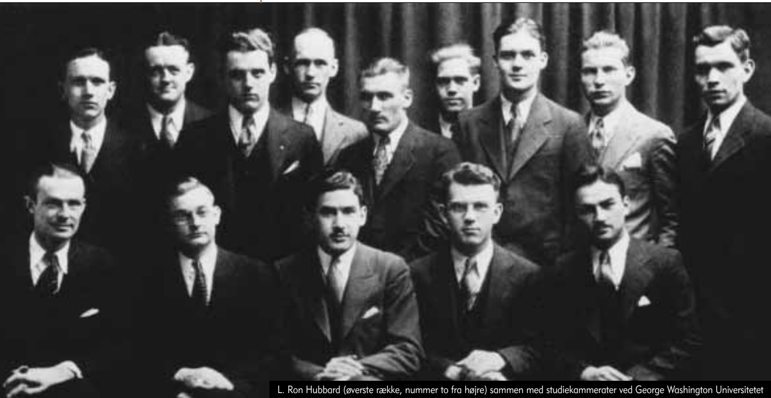
L. Ron Hubbard (øverste række, nummer to fra højre) sammen med studiekammerater ved George Washington Universitetet

L Ron Hubbard vendte i 1929 tilbage til USA og genoptog sin skolegang på Swavely forberedelsesskole i Manassas i Virginia, og han afsluttede med eksamen fra Woodward drengeskole i Washington.